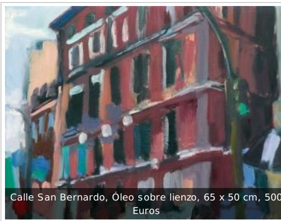
Calle San Bernardo, Óleo sobre lienzo, 65 x 50 cm, 500 Euros